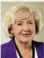
Gastrednerin Renate Schmidt, MdB

Bundesministerin a. D. für Familie, Senioren, Frauen und Jugend