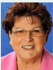
Gastrednerin Barbara Stamm

Bundesministerin a. D. für Familie, Senioren, Frauen und Jugend