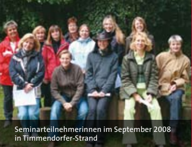
Seminarteilnehmerinnen im September 2008 in Timmendorfer-Strand