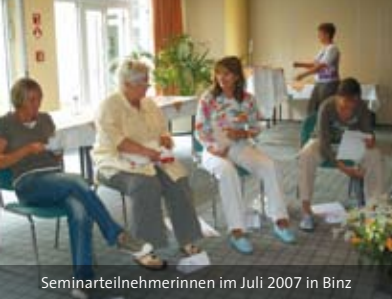
Seminarteilnehmerinnen im Juli 2007 in Binz