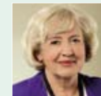
Gastrednerin Renate Schmidt, MdB Bundesministerin a. D. für Familie, Senioren, Frauen und Jugend

Gleich zwei prominente Gastrednerinnen! Die engagierten Politikerinnen Renate Schmidt und Barbara Stamm greifen hochaktuelle Themen auf und geben Ihnen Antworten auf Ihre Fragen.